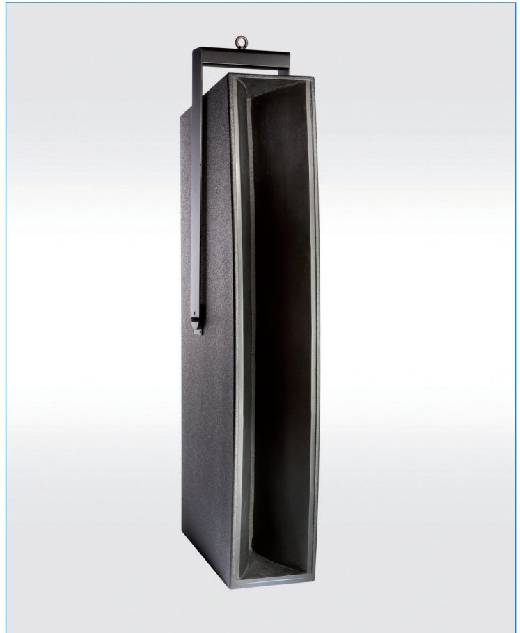
Enceinte SECTOR SC25

L'enceinte SECTOR SC25 APG se caractérise par son faisceau acoustique atypique destiné spécifiquement à la diffusion sonore de haute précision et longue portée de la bande médium-aiguë.