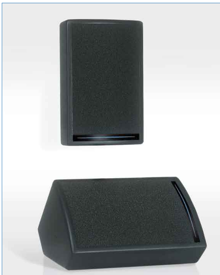
Enceintes MC1 présentées en façade ou en retour de scène

La MC1 est une enceinte satellite de très faible encombrement offrant une totale polyvalence entre les applications de retour de scène et de façade avec ou sans caisson de basses.