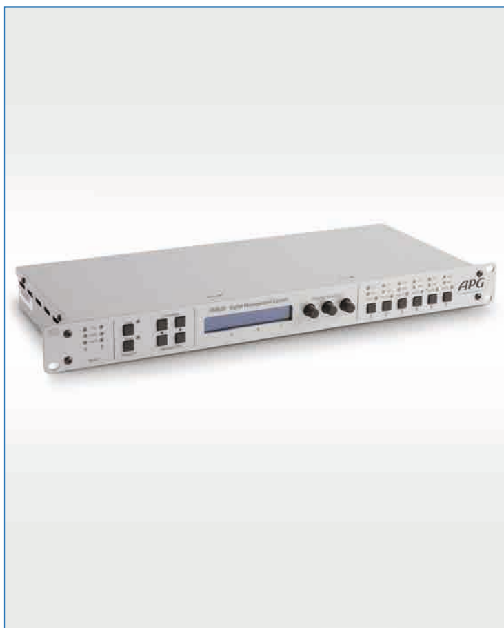
Processeur numérique de configuration DMS26

Le processeur numérique APG DMS26 est destiné d'une part à la gestion et au traitement des systèmes multi-diffusion et d'autre part au processing de haut-parleurs dans les cas d'exploitation où les systèmes ne sont pas exploités à leur maximum de puissance.