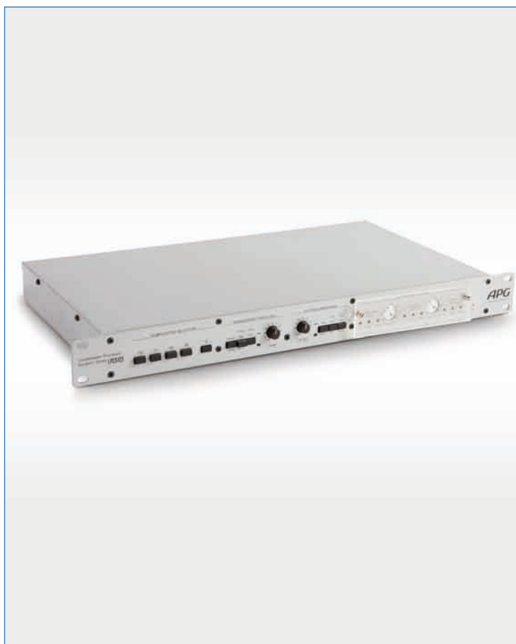
Processeur type LP

Chaque processeur est spécifique à un modèle d'enceinte ou système. Le choix du type de subwoofers est ouvert grâce au clavier de sélection.