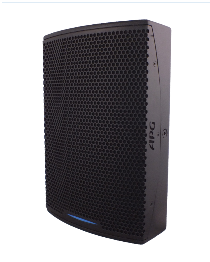
Enceinte iX8 M2

L'iX8 M2 est une enceinte satellite optimisée pour la sonorisation de haute précision en installation fixe en intérieur. Ses dimensions réduites la destinent à la sonorisation des petites surfaces ainsi qu'à la couverture répartie de grands espaces devant respecter un critère de discrétion.