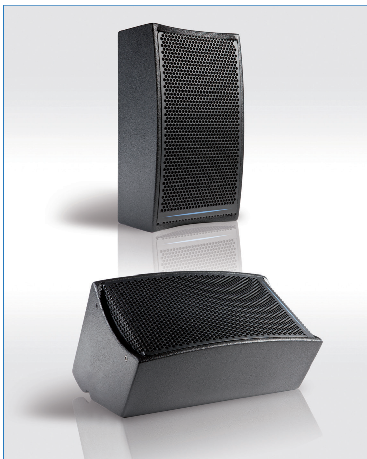
Enceinte DX8 présentée en façade et en retour de scène

La DX8 est une enceinte satellite offrant une totale polyvalence entre les applications de retour de scène et de façade avec ou sans renfort de grave. La DX8 est destinée à la sonorisation des petites et moyennes surfaces ainsi qu'à la couverture répartie de grands espaces. Sa compacité et sa clarté sonore en font le produit idéal pour les applications où la discrétion doit être conjuguée à une précision de restitution sonore élevée.