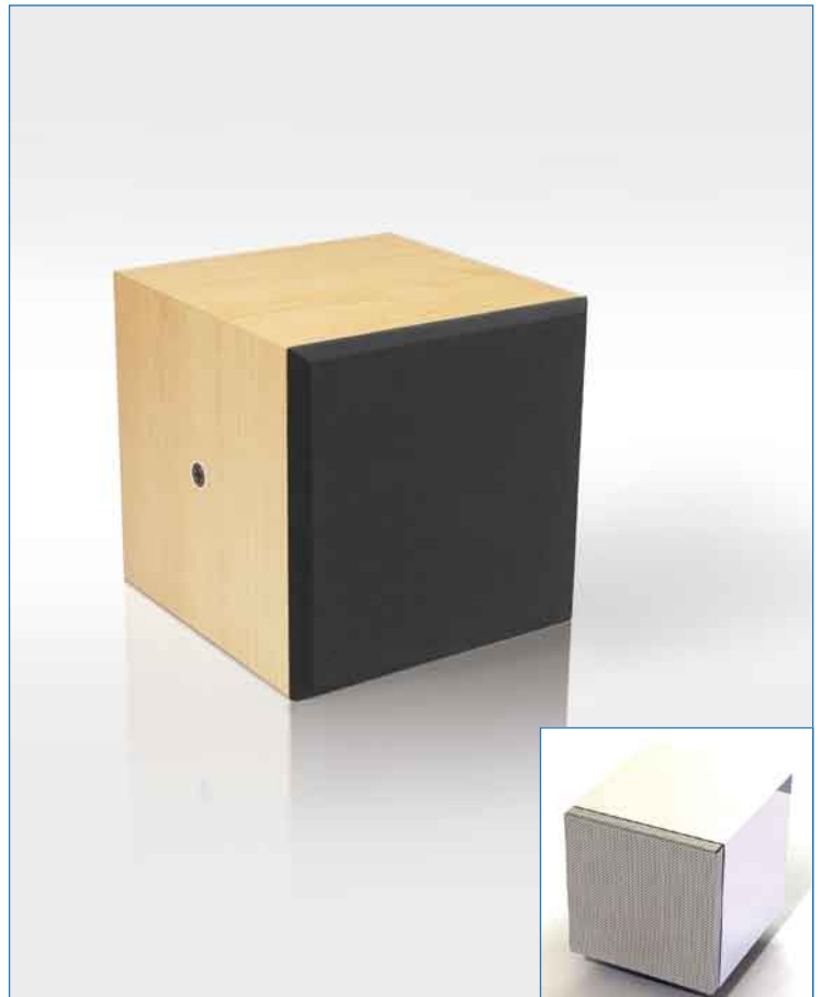
Une enceinte MX1 présentée en finition bois naturel clair (MX1) et en blanc (MX1GB)

Le processeur APG SPMX1 n'est pas nécessaire pour une utilisation de la MX1 en large bande. Toutefois il devient indispensable pour assurer le filtrage actif entre les enceintes de basses et les satellites quand un renfort de grave est nécessaire. Pour les renforts de basse, APG préconise l'emploi des "subwoofers" suivants : SUB12MX/N et SUB138P.