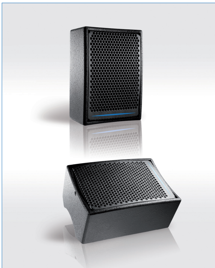
Enceinte DX5 présentée en façade et en retour

La DX5 est une mini enceinte satellite offrant une grande polyvalence entre tous les types d'écoute de proximité : retour de scène, diffusion répartie, contrôle d'écoute, complément de diffusion, façade avec ou sans renfort de grave. De par ses dimensions, la DX5 est destinée à la sonorisation des petites et moyennes surfaces ainsi qu'à la couverture répartie de grands espaces. Sa compacité et sa clarté sonore en font le produit idéal pour les applications où la discrétion doit être conjuguée à une qualité de restitution sonore élevée.