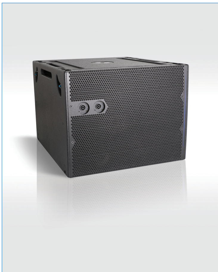
Enceinte de basse UNILINE UC115B

L'UC115B est l'enceinte de basse dédiée au système Line Array Modulaire Uniline Compact. Au niveau acoustique elle se caractérise par un excellent rapport taille/puissance. En termes de restitution sonore, l'UC115B délivre un grave sec, sans distorsion et avec une sensation d'impact et de précision. Au niveau ergonomique le système mécanique autorise tous les types d'installation : levage de grappes simples des différentes enceintes Uniline Compact, levage de grappes combinées entre UC115B et UC206W/N, mais encore empilement de groupes d'enceintes simples ou combinées entre elles. Ce système mécanique en 4 points rend possible le montage en configuration cardioïde aussi bien en mode posé qu'en mode accroché.