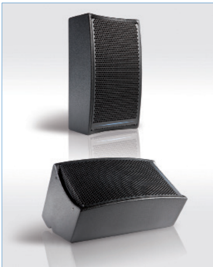
Enceinte DX8 présentée en façade et en retour de scène

Pour l'installation en fixe, est prévu l'étrier optionnel ETDX8. La DX8 peut être équipée, d'un transformateur pour les applications de sonorisation distribuée sur lesquelles un câblage en ligne 70V/100V est requis (options T50 ou T100).